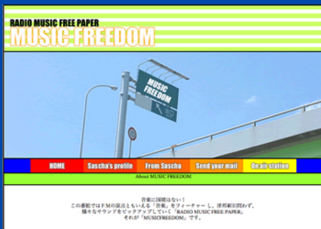
MUSIC FREEDOM番組HP (JFN内)