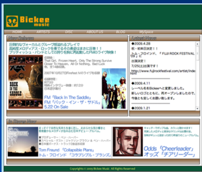
Bickee Music様 (インディーズCDレーベル)