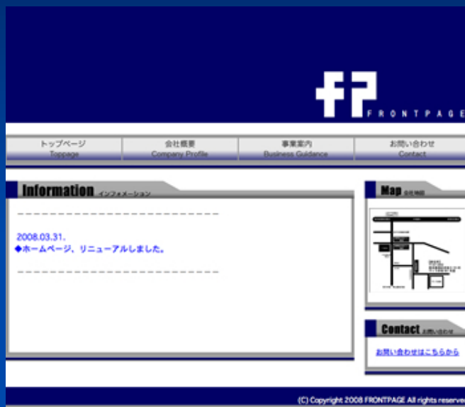
株式会社フロントページ様